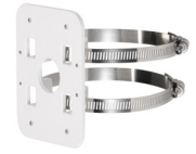
PFA152 Dispositif de Montage sur Mât